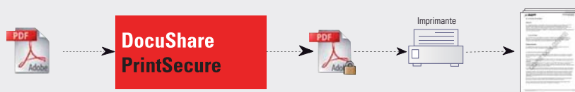
Schéma de fonctionnement

Impression sécurisée grâce à l'ajout d'un filigrane et d'un pied de page personnalisés.